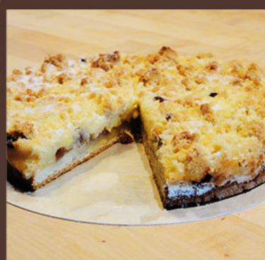
APFEL-STREUSEL MIT ROSINEN