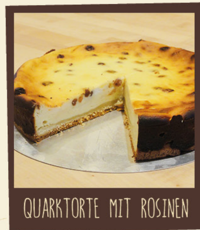
QUARKTORTE MIT ROSINEN